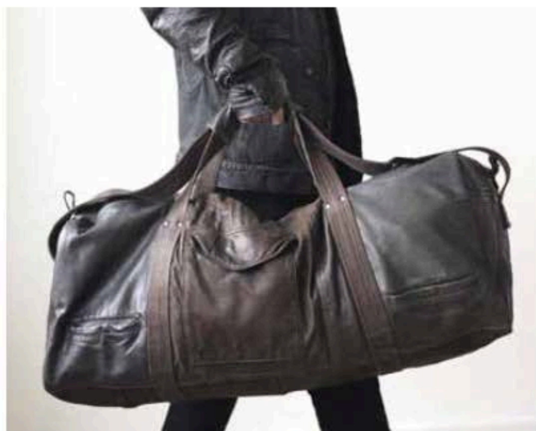
Eric Beauduin, te zien op het Arts & Crafts parcours. Boutique-atelier Eric Beauduin.

De vierde editie van de tweejaarlijkse tentoonstelling 'Intersections' (vanaf 16-09), vindt plaats in het ADAM en werd samengesteld