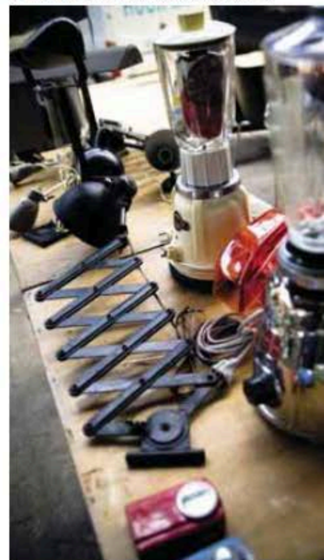
Brussels Design Market.