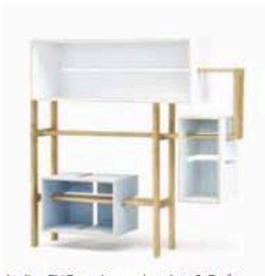
Atelier CNC, te zien op het Arts & Crafts parcours.